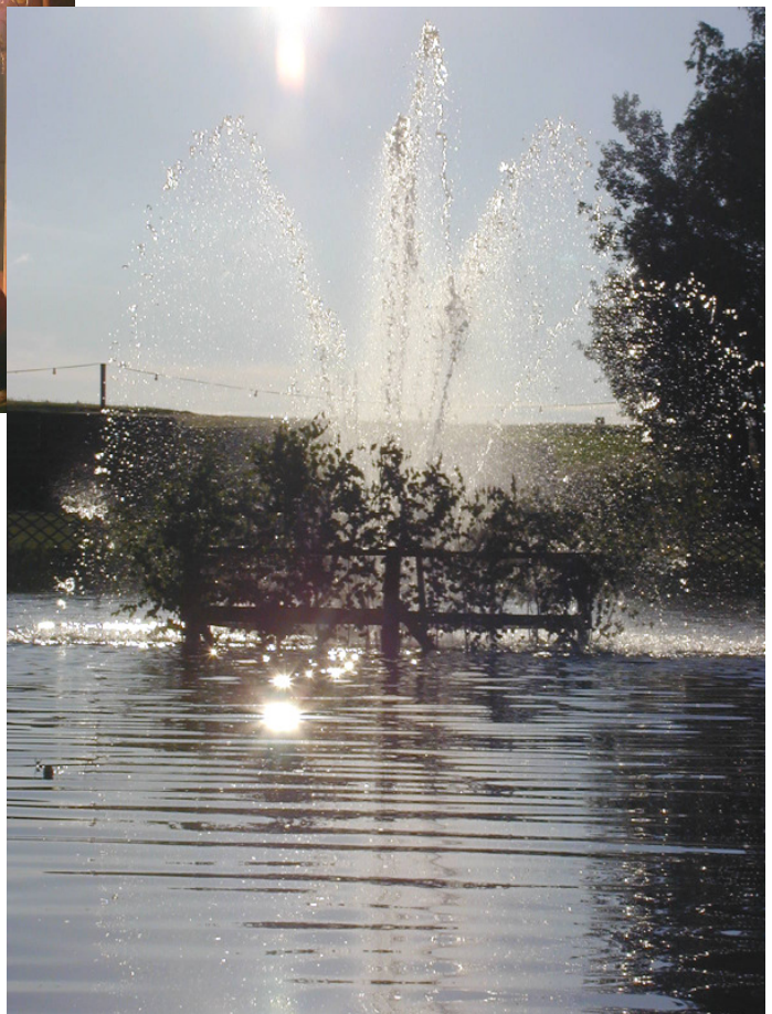
Der Springbrunnen ist immer wieder schön anzusehen