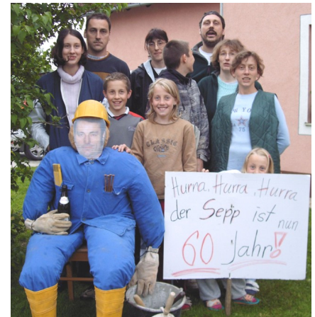
Seine Kinder überraschten den Jubilar mit einer Strohuppe

Brücken tragen seine Handschrift. So auch die in Sallingstadt. Leider erkrankte er kurz vor der Pensionierung schwer. Man darf sich nicht entmutigen lassen, meinte der Jubilar bei seiner Feier.