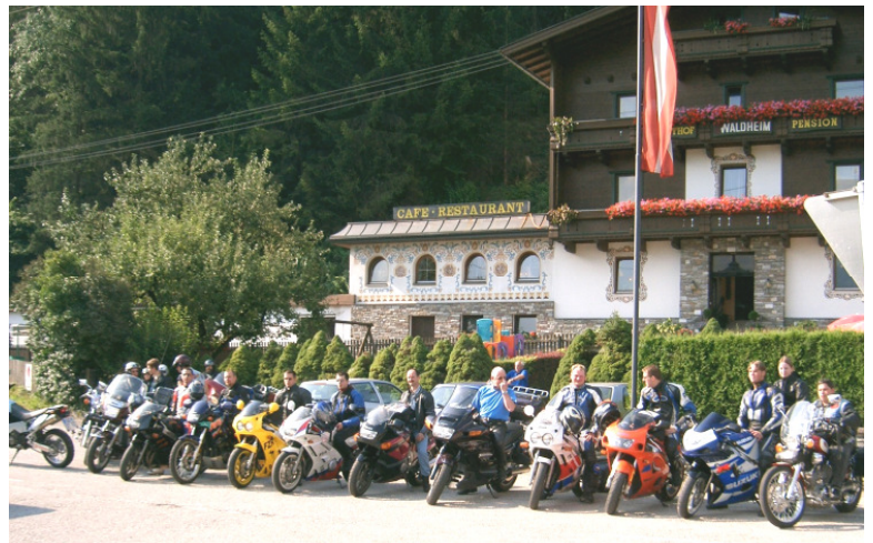
Ein großes Erlebnis war die heurige Ausfahrt der Biker für alle Teilnehmer

Bei aller Freude und Begeisterung sah man aber auch wieder die Gefährlichkeit dieses Hobbys. Der Organisator und Planer dieser und bereits vergange-