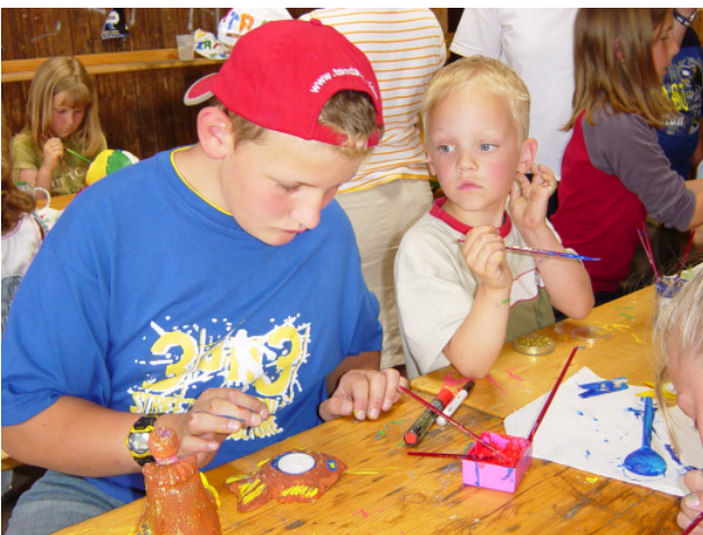
Der Kindernachmittag war für die Kleinen wieder sehr lehrreich