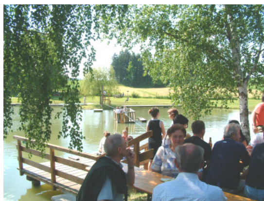
Zahlreiche Besucher kamen zur Saisonöffnung am Pfarrerteich

von 14.00 - 19.00 Uhr geöffnet. Beachvolleyballplatz, Tischtennistische und die Spielgeräte auf der Anlage waren den ganzen Nachmittag ausgelastet. Der Besuch der heurigen Badesaison beim Pfarrerteich ist aber einerseits aufgrund der schlechten Witterung im Juni und Juli sowie durch das neue Freibad in Zwettl rückläufig.