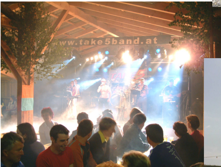
die Gruppe „Take5“ brachte die Teichfesthalle zum Kochen