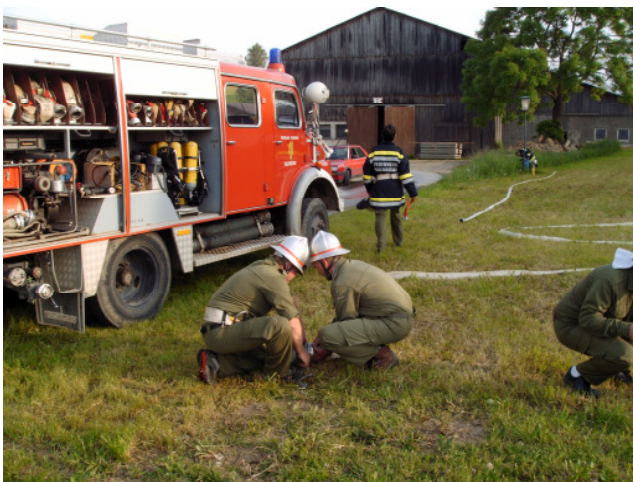
Bei der Einsatzübung wurde er Ernstfall geübt