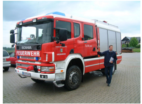
Ein Scania mit einem Rosenbaueraufbau wird das neue Tanklöschfahrzeug

Für diese Neuinvestition müssen ca. 260.000 Euro von Land, Gemeinde und der Feuerwehr Sallingstadt aufgebracht werden.