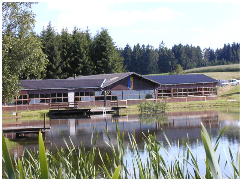
Das diesjährige Dorffest der Ortsvereine findet heuer in der Pfarrerteichhalle statt

nicht allzu schwer und für alle geeignet, die mitwandern können oder wollen. Gemeinsam treffen sich dann alle Wanderer und Nichtwanderer in der Festhalle beim Pfarrerteich ab ca. 11.00 Uhr. Hier wird zum Mittagessen eingeladen. Es gibt Spanferkel und Zwettler Bier (das Bier wurde von der Brauerei Zwettl gesponsert). Anschließend - gemütlicher Nachmittag mit Spaß und Spiel auf der wunderschönen Freizeitanlage Pfarrerteich!