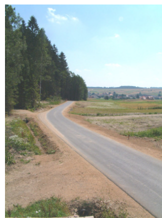
Der neue Güterweg Sallingstadt/Windhof wurde fertig gestellt

lingstadt nach dem Güterweg Reitersfeld, dem Güterweg Sallingstadt/ Perndorf und dem Güterweg Sallingstadt/ Mannshalm der bereits 4. Güterweg errichtet werden.