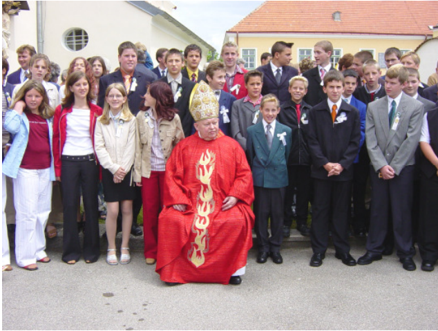
Bischof Dr. Kurt Krenn erteilte 43 Firmlingen in Schweiggers das Sakrament der Firmung

Firmung / Diözesanbischof Dr. Kurt Krenn führte in Schweiggers die Firmung und Generalvisitation durch. Schweiggers / „Ich hatte von Schweiggers schon vorher eine sehr hohe Meinung, jetzt ist sie noch viel höher geworden!“