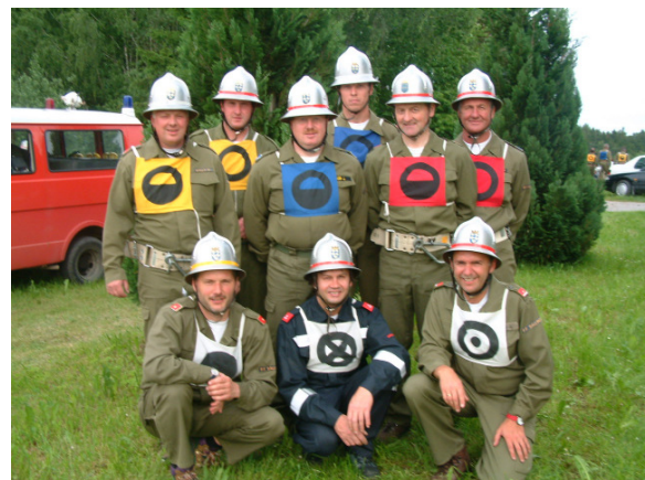
Zum letzten Mal trat die B-Gruppe zum Wettkampf an

beherrschen und im Staffellauf über 8 x 50 m war sportliche Fitness wichtig. Als Gewinner in der Abschnittswertung wurden folgend Wehren geehrt: Klasse Bronze A: Germanns mit 409,4 Punkten (Wanderpreis zum 1. Mal) Klasse Silber A: Großglobnitz mit 391,2 Punkten (Wanderpreis zum 1. Mal) Klasse Bronze B (mit Alterspunkten): Gschwendt mit 407,8 Punkten (Wanderpreis zum 1. Mal) Klasse Silber B: Jahnings mit 393,3 Punkten (Wanderpreis zum 2. Mal) Sallingstadt trat mit 2 Bewerbungsgruppen an und schlug sich unterschied-