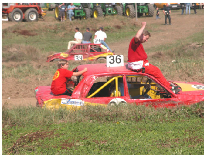
Unser Team startet beim Autocrash in Brunnhöf wieder voll durch

Am Sonntag, dem 5. September finden ab 9.00 Uhr wieder die legendären Autocrash- Rennen des MSC Niederösterreich Nord und seiner Konkurrenten statt. Da bei diesen Rennen wieder einige Fahrer aus unserem Gemeindegebiet teilnehmen, wäre es für sie ein zusätzlicher Ansporn, wenn sie durch Applaus und Zurufe aus dem Publikum zu ihren Höchstleistungen motiviert werden. Bei Schlechtwetter wird diese Veranstaltung auf Sonntag, den 12. September 2004 verschoben.