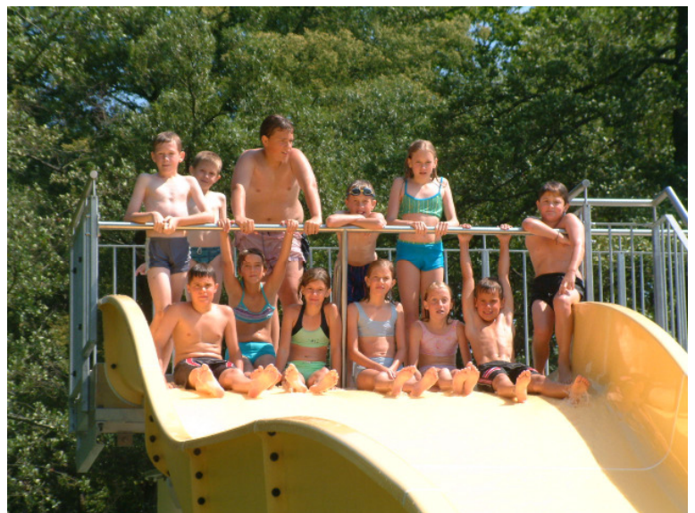
Die Musikschulkinder mit ihren Geschwistern verbrachten auf Einladung des Vereines einen schönen gemeinsamen Badetag in Zwettl

lenbad nach Zwettl. Nach anfänglichem Regen schlug das Wetter auf herrlichen Sonnenschein um. Am späten Nachmittag wurde dann noch McDonalds besucht. Zum Abschluss gab es für alle Beteiligten noch ein Beachvolleyballmatch am Pfarrerteich und Kaffee bei der Fam. Bauer Josef.