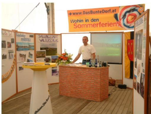
Beim 1. Waldviertelfest wurden die Aktivitäten rund um den Verein präsentiert

Beim 1. Waldviertelfest vom 10. bis 13. Juni 2004 in Rahmen der BIOEM in Großschönau war der Verschönerungsverein Sallingstadt/ Walterschlag mit einem eigenen Stand vertreten. Dabei konnten den zahlreichen Interessierten die wichtigsten Dorferneuerungsaktivitäten und Veranstaltungen in unseren Orten