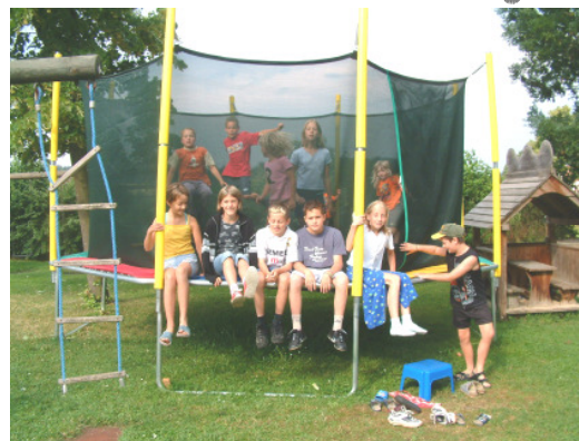
Besonders die Kinder sind vom neuen Spielgerät am Kinderspielplatz in Sallingstadt begeistert