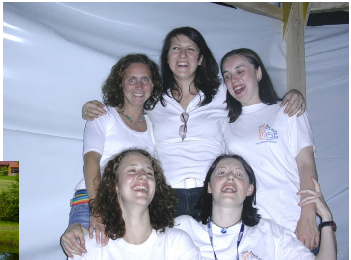
Unser Schankpersonal in der Bar hatte offensichtlich einen Riesenspaß bei der Arbeit

Der Teich ruft! Auch heuer folgten die Besucher wieder dem Ruf des „Waldviertler Donauinsselfestes“ und strömten in Massen zum 27. Sallingstädter Teichfest. An den Ufern des Pfarrerteiches präsentierte die Ortsgemeinschaft den Fans wieder ein rundum stimmungsvolles Fest.