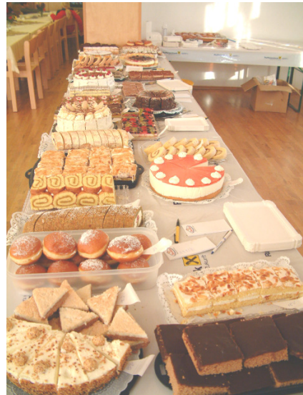
Mit frischgebackenen Mehlspeisen werden die Besucher des Bauernmarktes verwöhnt

Ein interessantes Rahmenprogramm, wie der Frühschoppen im Jugendgästehaus am Vormittag und die Dichterlesung heimischer Poeten umrahmt von heimischer Volksmusik am Nachmittag, lassen einen gemütlichen Sonntag in Sallingstadt erwarten.