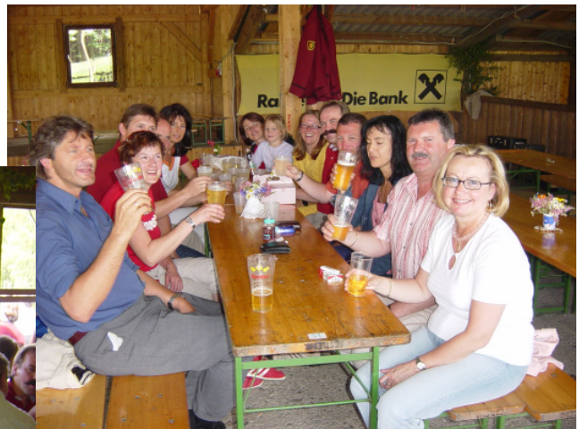
Die vielen Teichfestfans hatten wieder einmal jede Menge Spaß und Unterhaltung