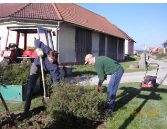
Die Sallingstädter Dorferneuerer beteiligten mit einer Bepflanzung und einem Frühjahrsputz am landesweiten Aktionstag

Zum mittlerweile dritten Mal nach 2005 und 2007 fand am 25. April 2009 der Aktionstag der NÖ Dorf- und Stadterneuerung statt. Diesen "Tag der offenen Tür" der Dorf- und Stadterneuerung in Niederösterreich nahm auch Sallingstadt zum