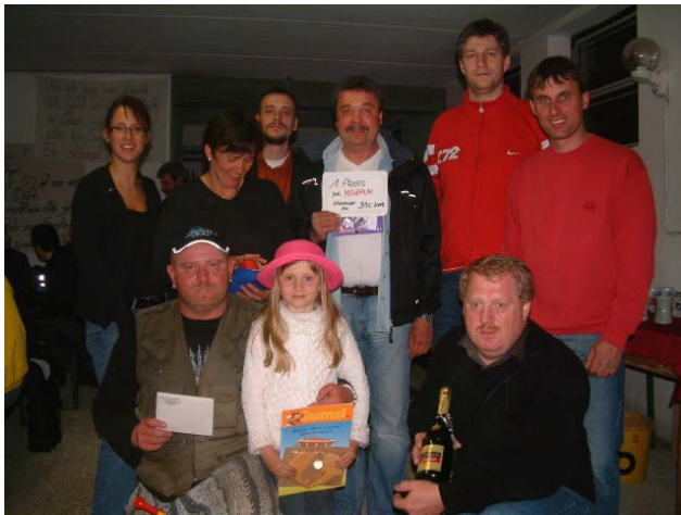
Die glücklichen Gewinner bei der Verlosung freuten sich über die Preise.