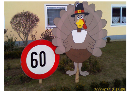
Mit einem lustigen Truthahn überraschten die Freunde das Geburtstagskind.

trieb im Dorf ist. Nebenbei ist er nicht nur sportlich bei der Union Schweiggers aktiv, sondern auch im Dorf. Sein wichtigster Verdienst sind die Aktivitäten im Vorstand des Verschönerungsvereines. Schon im Jahre 1975 war er Mitglied des Proponentenkomitees. Seine organisatorischen Fähigkeiten stellte er besonders beim Pfarrerteich und beim Jugendgästehaus, wo er die Aus-