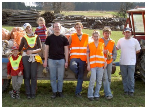
Walterschläger „Müllsammler“ säuberten das Dorf

So haben sich am Samstag, dem 4. April, auch in Walterschlag und in Sallingstadt viele Freiwillige gefunden, die den Abfall gesammelt und weggeräumt haben. Das Ergebnis war ein gehäufter Traktoranhänger, der dann zur Altstoffsammelstelle nach Schweiggen gebracht wurde, wo es zum Dank eine kleine Jause gab.