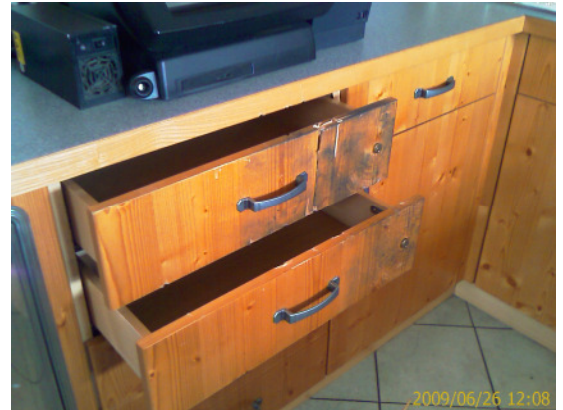
Unbekannte Täter richteten beim brutalen Einbruch großen Sachschaden an.

Der verursachte Gesamtschaden ist derzeit nicht bekannt.