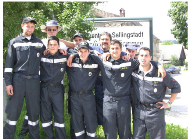
Gleich fünf Florianijünger freuten sich über das Leistungsabzeichen in Bronze und Silber