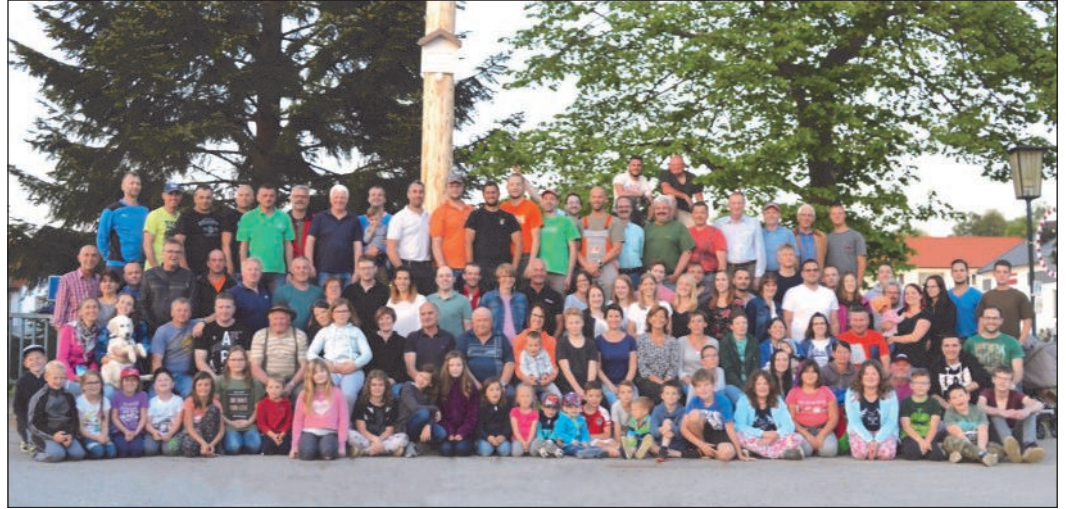
Traditionelles Gruppenfoto nach getaner Arbeit

Das Gespräch am Lagerfeuer konzentrierte sich auf die nächsten Projekte in der Ortschaft und alte Geschichten von Früher. Der 37 Meter hohe Baum steht damit nicht nur eine Nacht lang, sondern den gesamten Mai lang im Mittelpunkt der Ortschaft. Vielen Dank seitens der Jugend an alle Helfer und an die Dorfleute für den entspannten Abend miteinander!