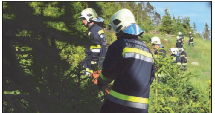
Durchsuchen des Waldes mit einer Menschenkette