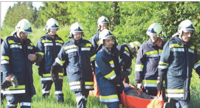
Die gesuchte Person wurde anschließend aus dem Wald getragen

im Herbst bei Dämmerung zu wiederholen, um unter noch schwierigeren Bedingungen zu üben.