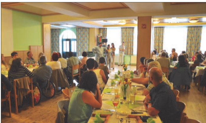
Gute Unterhaltung und gutes Essen an einem Abend kombiniert

Das Publikum durfte dann am Schluss entscheiden wie das Stück ausgeht. Dazu servierte das Dorfwirtshausteam ein exklusives 3-Gang-Menü vom Feinsten. Das zahlreich ge-