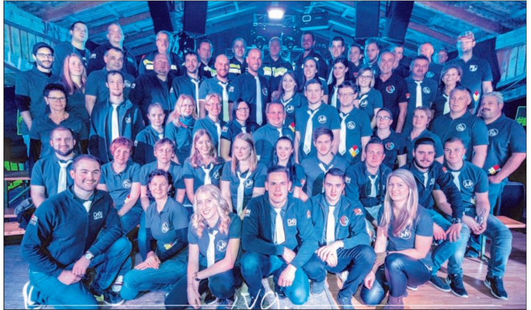
Gruppenfoto vor Beginn der Veranstaltung mit allen Helfern