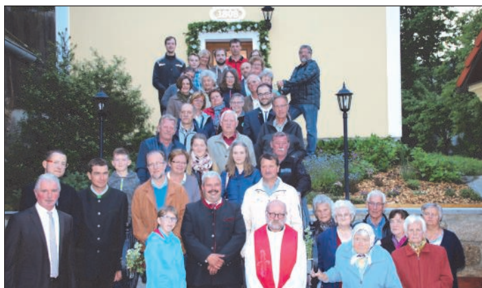
Zahlreiche Teilnehmer bei der Segnung