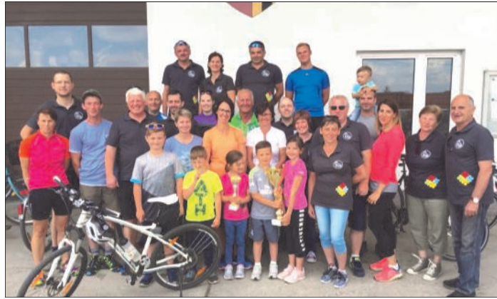
Nach der Siegerehrung wurde noch ein Gruppenfoto mit den verbliebenen Teilnehmern aus Walterschlag, Sallingstadt und Windhof gemacht.

Der diesjährigen Radwandertag am 10. Mai 2018 in Schweiggers war wieder sehr gut von vielen Gruppen und privaten Radfahrern besucht. Die Strecke verlief heuer von Schweiggers – Unterwindhag – Mödershöf – Schwarzenbach – Brunnhöf – Meinhartschlag – Mannshalm – Schweiggers. Durch das traumhafte Wetter, entschieden sich sehr viele für diese längere Strecke, zirka 15km. In Schwarzenbach im Dorfhaus gab es