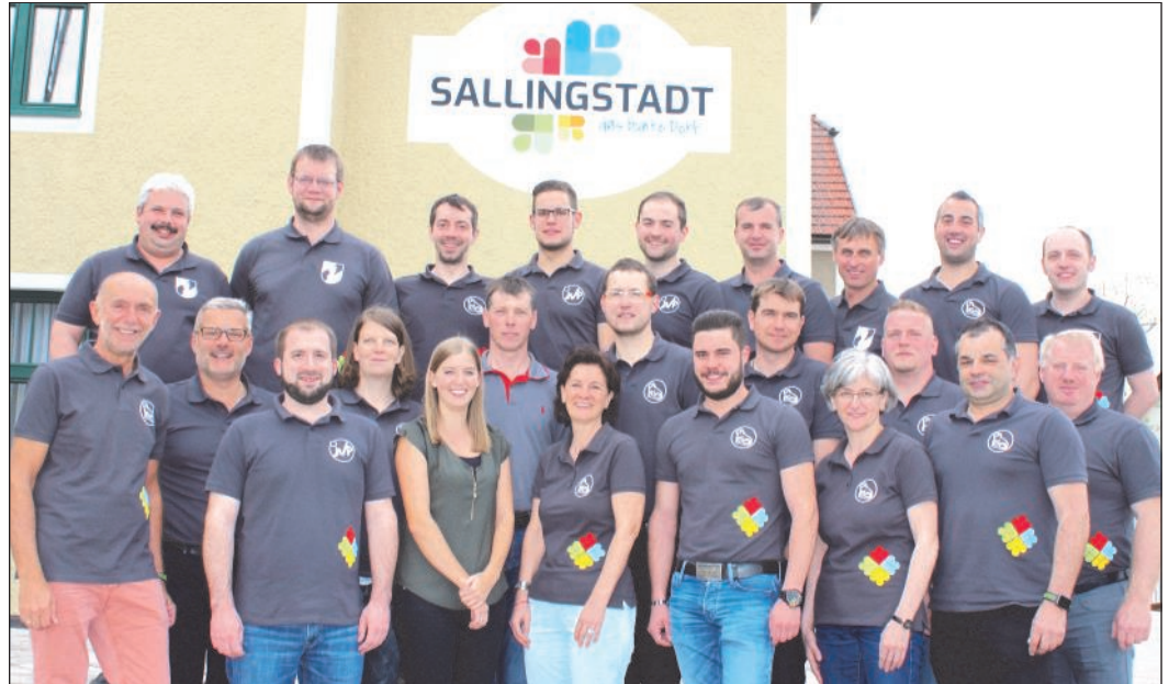
Gruppenfoto aller Vorstandsmitglieder des Verschönerungsvereins Sallingstadt und Umgebung vor dem neuen Logo, das anlässlich des Jubiläums "750 Jahre Sallingstadt" entwickelt wurde: