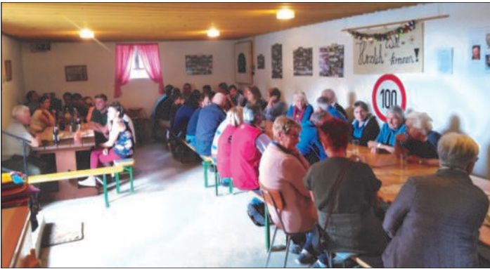
Viele Besucher beim Maibaumaufstellen in Windhof

Wie schon in gewohnter Manier, stellten auch dieses Jahr die Windhofer wieder ihren geschmückten Baum am 01. Mai auf.