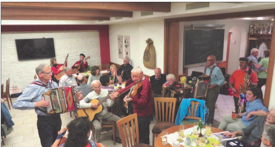
Zahlreiche Musikanten aus nah und fern waren gekommen.

Ein herzliches Dankeschön an alle Mitwirkenden sagt das Musistammtisch-Team des Dorfwirtshauses Sallingstadt.