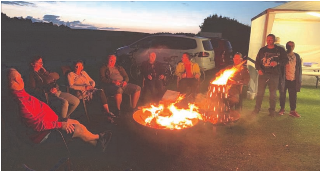
Am Mittwochabend wurden noch einige Stunden gemütlich beim Lagerfeuer verbracht.

Die Arbeitsgruppe Sportplatz möchte sich hiermit nochmal bei allen Sportlern und Besuchern sehr herzlich bedanken und freut sich schon jetzt auf die sportlichen Tage im Jahr 2020.