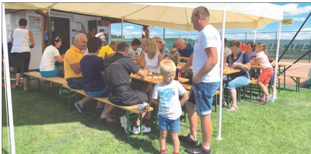
Bei schönem Wetter gab es am Feiertag köstliche Grillhendl.

Begonnen wurde am Mittwochabend mit ein paar sehr unterhaltsamen Gras-Volleyballspielen und ein paar heißumkämpften Tischtennispielen. Danach wurde gemeinsam mit den Kindern an den vorbereiteten Feuerschalen Würstel gegrillt. Durch den einigermaßen warmen Abend blieben die Gäste doch einige Stunden bei den Feuerschalen sitzen und es wurde noch bis in die späten Nachtstunden getratscht und gelacht.