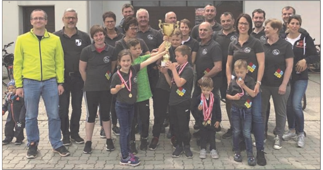
Von klein bis groß, die zahlreichen Teilnehmer der Gruppe Sallingstadt.

Der Mittagstisch war reichlich gefüllt mit Kistensau, Kraut und Knödln oder Sur-