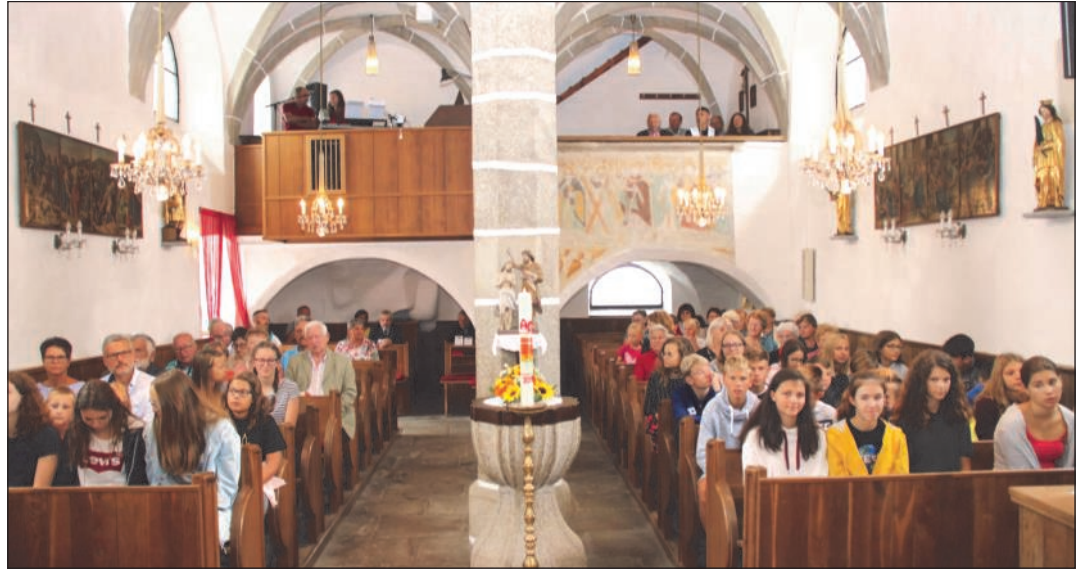
Dank einer Katholischen Jungschar aus Bruck an der Leitha war die Kirche voll besetzt

Anschließend wurde zum Pfarrfest in den Pfarrhof eingeladen. Einige Gutgläubige blieben gleich im Pfarrhofgarten sitzen und hatten Glück mit dem Wetter, denn