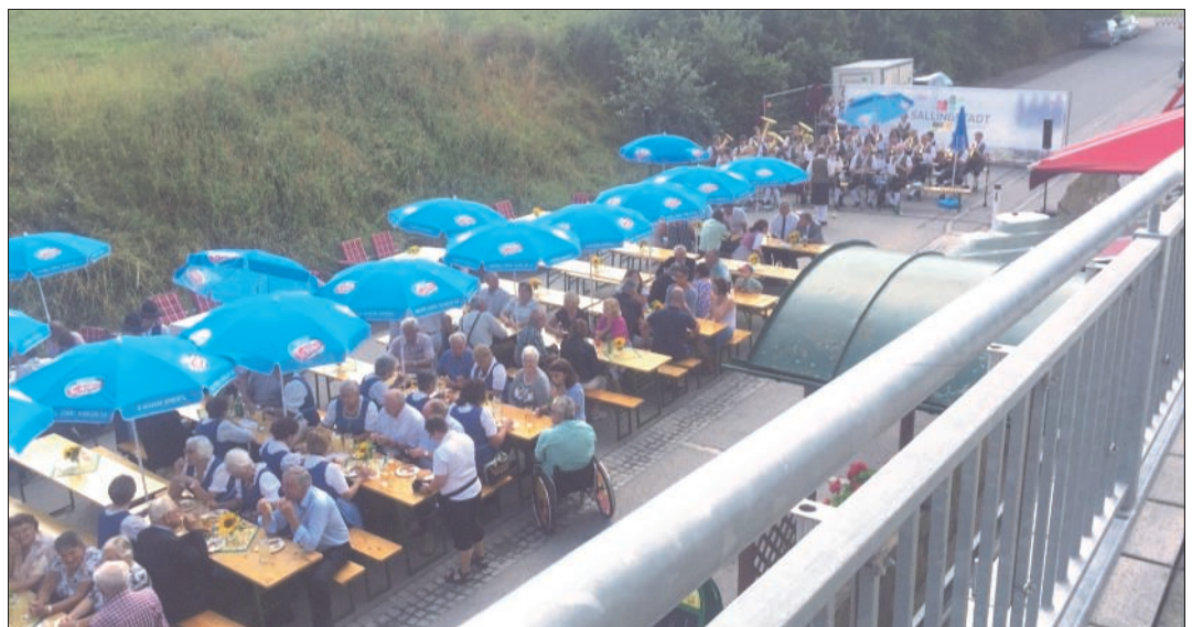
Bei tollem Wetter kamen viele Gäste, die den Wirtshauskirtag genossen.

Anschließend ging es zum Festplatz auf der Straße vor dem Dorfzentrum. Hier spielte der Musikverein