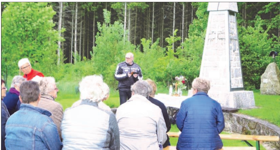
Das Jubiläum wurde in Form einer Maiandacht gefeiert.

Im Anschluss an die Andacht gab es eine Agape, bei der die Feier in gemütlicher Runde ihren Ausklang fand.