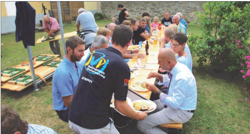
Anschließend wurde zum Pfarrfest in den Pfarrgarten eingeladen.