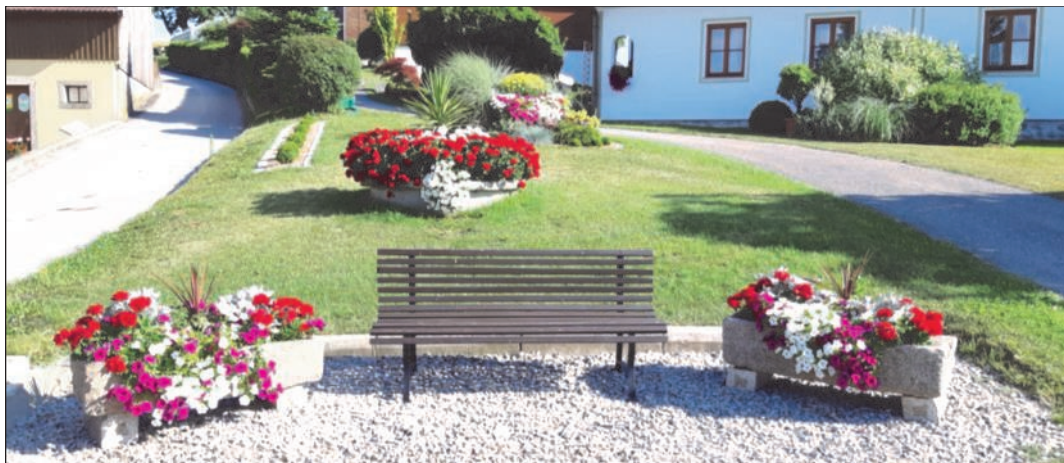
Der neu gestaltete Platz des ehemaligen „Milchhauses“