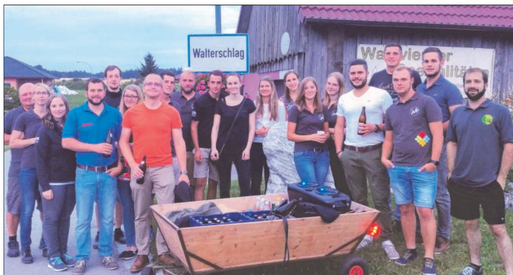
Die Jugendgruppe beim Zwischenstopp in Walterschlag.

Dort angekommen stärkten sich alle bei leckerem Essen und es wurde noch das eine oder andere Getränk konsumiert.